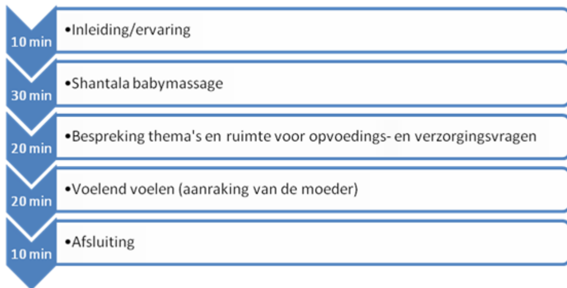
Figuur 2. Opbouw van de interventie.

*Noot. De georganiseerde categorieën A, B en C vormen 100%. De gedesorganiseerde categorie D is een extra categorie die bovenop een georganiseerde categorie komt.