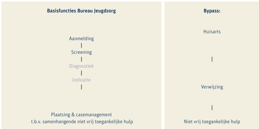
Figuur 4. Basisfuncties Bureau Jeugdzorg en bypass in Wet op de Jeugdzorg (2005)

Bureau Jeugdzorg werd uiteindelijk in 2005 verankerd in een wet, de Wet op de Jeugdzorg geheten. Maar het was een Bureau Jeugdzorg waar essentiële onderdelen uit waren gesloopt (figuur 4). De vernieuwing was geen vernieuwing meer. Ik vind het geen verrassing dat de nieuwe wet niet werkte.