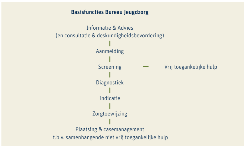
Figuur 3. Basisfuncties Bureau Jeugdzorg volgens Projectgroep Toegang (1996)