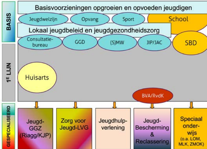
Figuur 2. Landschap jeugdstelsel vanaf ± 1990

Maar zoals gezegd, de jeugdzorg functioneert op dit moment niet goed. Al decennia niet. Om beter te begrijpen hoe dat komt, neem ik u mee naar het landschap van alle voorzieningen die bedoeld zijn om kinderen, jongeren en gezinnen te ondersteunen. Ik bedoel dan het totale landschap waarvan de jeugdzorg onderdeel is. Dit plaatje (figuur 2) toont een vereenvoudigde kaart van het landschap rond 1990.