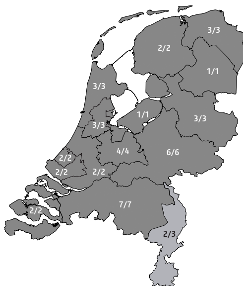
Figuur 5.2 Roc's met ZAT naar provincie/grootstedelijke regio, 2011 (in aantallen, N=44)

De getallen in de kaart representeren het aantal roc's met een of meer ZAT's (vermeld in de teller) en het aantal roc's in de regio (vermeld in de noemer).