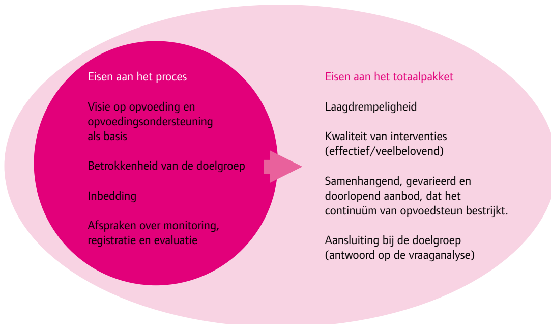
Fig 2. Kwaliteitseisen en criteria voor opvoedingsondersteuning

Eisen en criteria voor opvoedingsondersteuning zijn grofweg in te delen in eisen die aan het proces worden gesteld en eisen die aan het totaalpakket worden gesteld. Schematisch zijn alle eisen en criteria voor opvoedingsondersteuning hieronder kort samengevat: