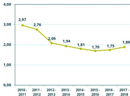
Percentage voortijdig schoolverlaters per schooljaar